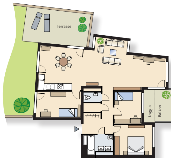
4-Zimmer-Wohnung mit Loggia, Balkon, Terrasse, Garten (Haus 24, Top 3)

Wohnfläche: 87,17 m 2 Loggia: 6,8 m 2 Balkon: 12,92 m 2